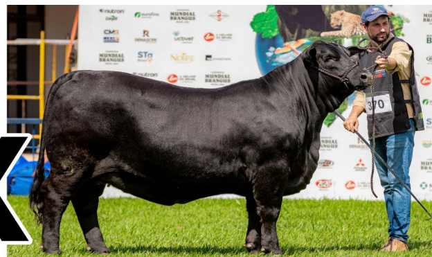
FIV 3215 ILUMINADA